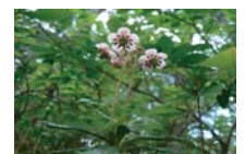
オオウメガサソウ