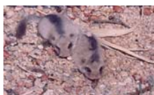
国指定天然記念物ヤマネ